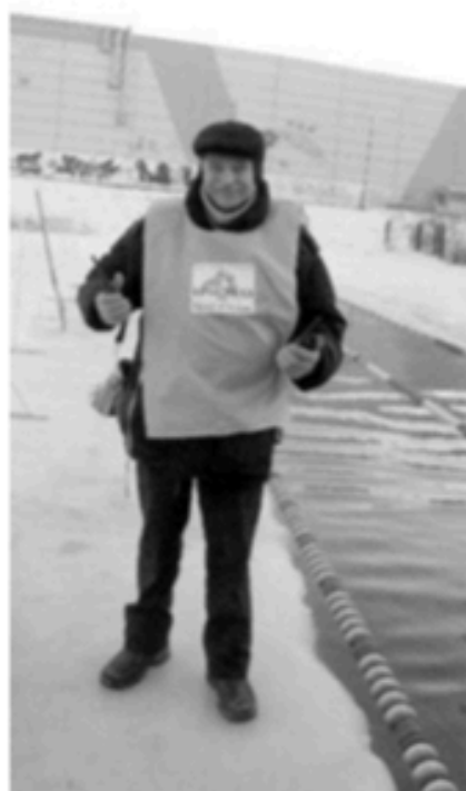
Фото 1. Автор заметки во всеоружии перед началом соревнований по зимнему плаванию в клубе "Кристалл" (г. Тюмень). Клуб принимал спортсменов Уральского региона

старта, объявления результатов и т.п.). В паузах сообщений одного можно вставлять короткие сообщения другого, причём, это будет осуществляться с разных мест, а оповещающие могут передвигаться.