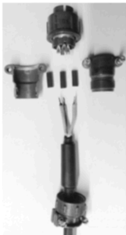
Фото 3. Вверху – вилка ШР20 без корпуса, его части расположены слева и справа от отрезков термоусадочной трубки, которые одеваются на провода перед пайкой их к вилке, за утолщением внизу фото одет хвостовик вилки

трубки F32-3,5 длиной по 13...15 мм – фото 3 , провода припаяются к вилке, согласно схеме того устройства, с которым данный кабель будет работать, отрезки термоусадки (после промывки паяк) одеваются поверх паяк и усаживаются с помощью фена – фото 4 , затем внутрь половины разъёмного корпуса вилки наносится силиконовый компаунд Done Deal DD6807, корпус собирается на вилке, внутрь корпуса до заполнения добавляется ещё компаунд, половины корпуса скрепляются наворачиванием хвостовика, затем фиксируются имеющимися винтами. Взяв рукой за утолщение на кабеле, перемещаем его до предела внутрь корпуса вилки, следя за тем, чтобы утолщение не смещалось