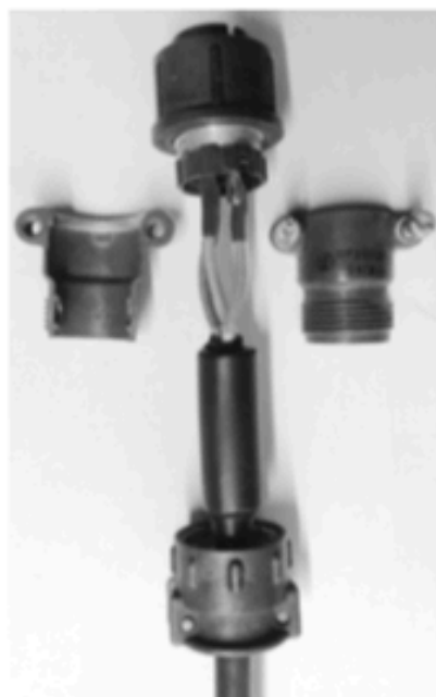
Фото 4. Провода припаяны, отрезки термоусадочной трубки обсажены на местах паяк с помощью фена. В левую часть корпуса загружается компаунд, эта часть подкладывается под провода, которые тоже обильно смазываются компаундом, правая часть корпуса устанавливается сверху. Удерживая вилку за корпус со стороны кабеля, в него добавляется компаунд "под завязку", затем на корпус навёртывается хвостовик (внизу фото), после этого части корпуса вилки стягиваются имеющимися винтами. Выступающая утолщённая часть под термоусадкой вталкивается до упора внутрь корпуса вилки, перемещение утолщения под термоусадкой по кабелю, при этом, следует исключить. Винтами следует притянуть "мостик" на хвостовой части вилки, закрепив, таким образом, вилку на кабеле

трубки F32-3,5 длиной по 13...15 мм – фото 3 , провода припаяются к вилке, согласно схеме того устройства, с которым данный кабель будет работать, отрезки термоусадки (после промывки паяк) одеваются поверх паяк и усаживаются с помощью фена – фото 4 , затем внутрь половины разъёмного корпуса вилки наносится силиконовый компаунд Done Deal DD6807, корпус собирается на вилке, внутрь корпуса до заполнения добавляется ещё компаунд, половины корпуса скрепляются наворачиванием хвостовика, затем фиксируются имеющимися винтами. Взяв рукой за утолщение на кабеле, перемещаем его до предела внутрь корпуса вилки, следя за тем, чтобы утолщение не смещалось