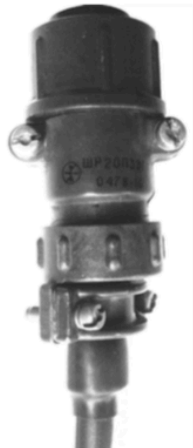
Фото 5. Результат после окончательной сборки вилки на кабеле: кабель не выдёргивается из корпуса вилки, не подвергается переломам в месте выхода из корпуса вилки, влага и грязь не проходят внутрь корпуса вилки и внутрь кабеля, благодаря набивке корпуса вилки компаундом

Операция по установке вилки на кабель успешно завершена: провода кабеля надёжно припаяны к штырькам вилки и зафиксированы отрезками термоусадочной