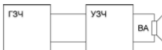
Рис. 1. Блок-схема установки для определения граничной частоты органов слуха